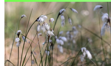
Linaigrette à feuilles étroites

Par un aller-retour vous découvrirez un parcours aménagé autour de l'étang de La Lande Forêt qui traverse une tourbière, un bois marécageux, une forêt de feuillus, riches d'une faune et d'une flore remarquables.