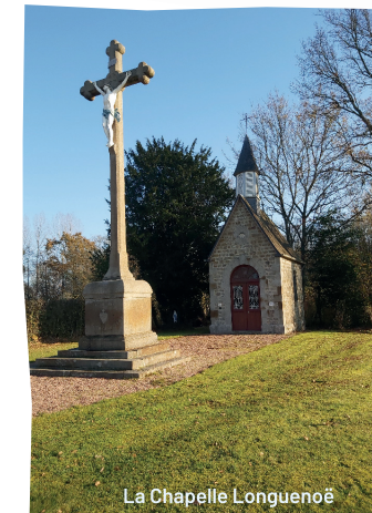
La Chapelle Longuenoë

A la D308, prudence ! La traverser. Tourner à droite puis tout de suite à gauche jusqu'au chemin goudronné (Arthan).